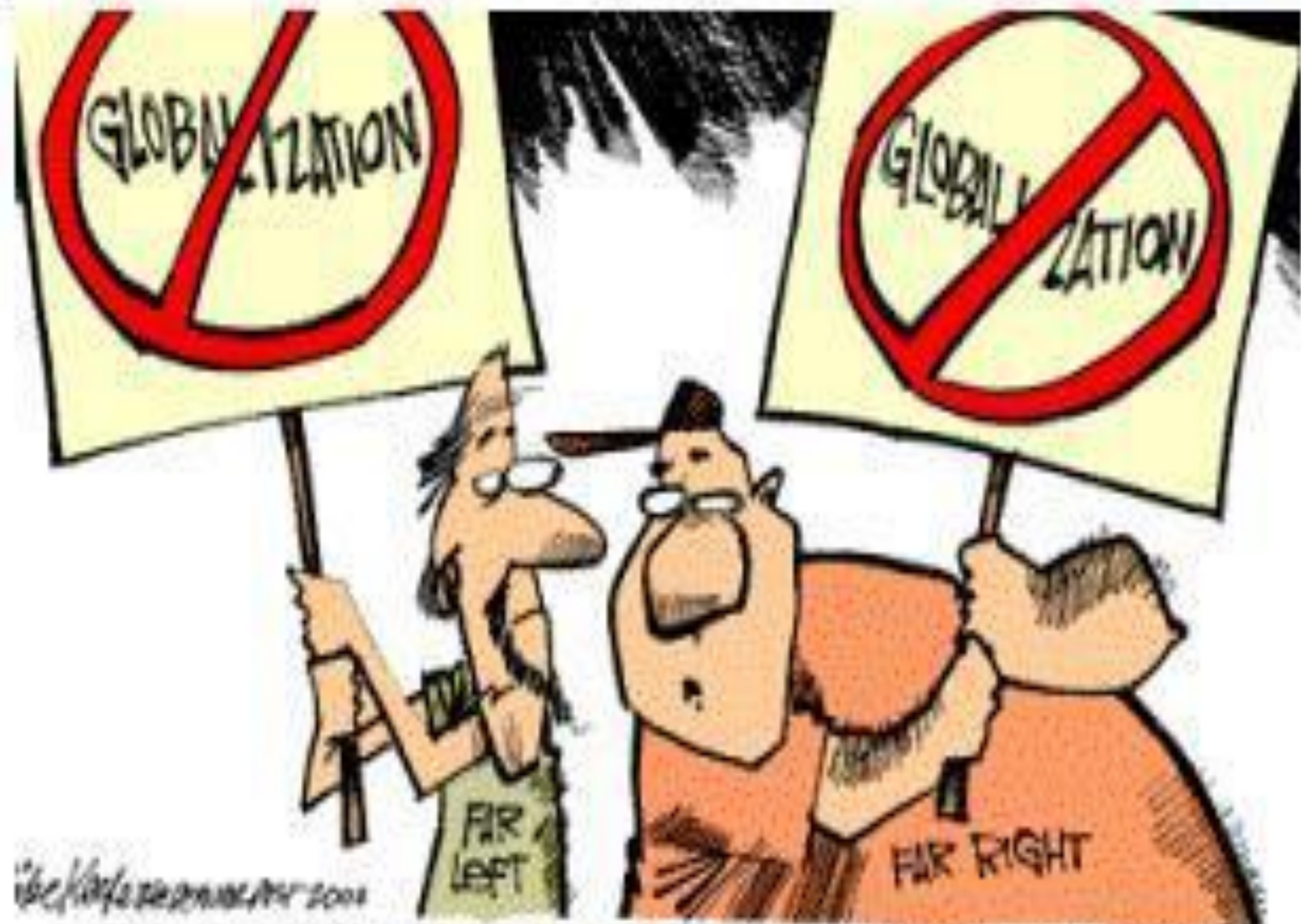
THE STRONGEST ARGUMENT FAVORING A GLOBALIZED ECONOMY...